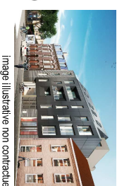
Image illustrative non contractuelle